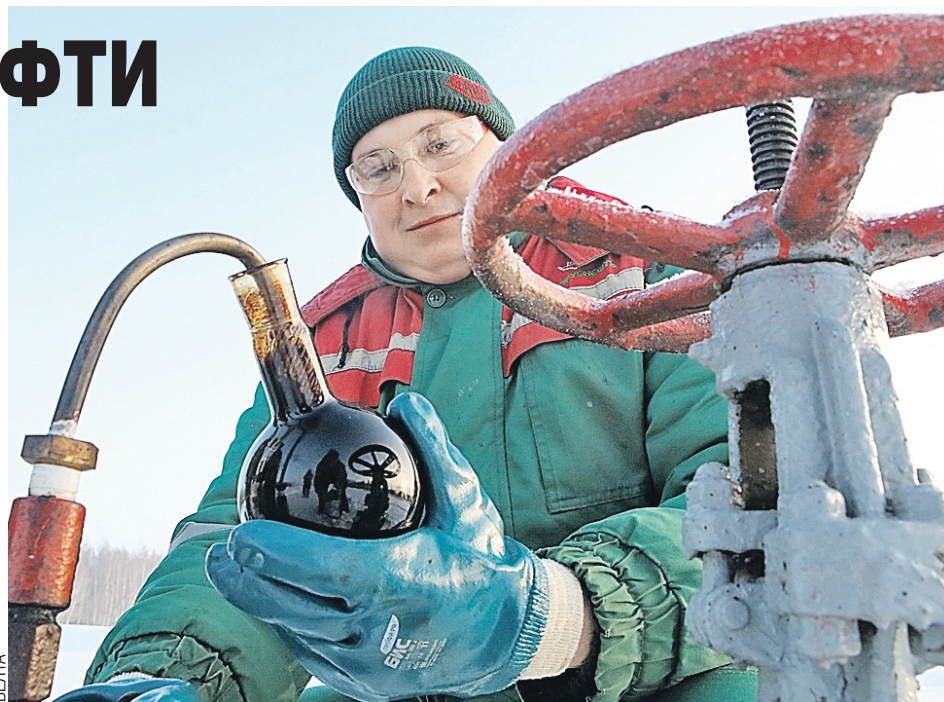
Пока наши страны договариваются, полезные ископаемые все так же добываются.

По мнению опрошенных экспертов, в полном объеме российская сторона все же не будет компенсировать соседям убытки из-за налогового маневра. Скорее всего, эти издержки будут компенсированы в какой-то другой сфере, поскольку РФ высоко ценит Беларусь как своего тесного союзника и стремится к максимальной интеграции. И какие-то возмещения белорусской