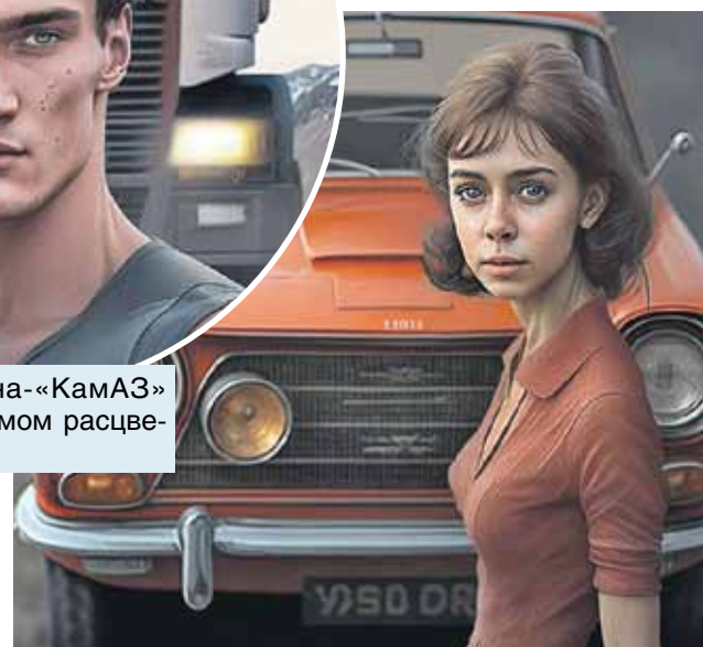
Русскую «Лад» нейросеть видит девушкой, чем-то похожей на Лиду из «Операции Ы». Только грустнее.