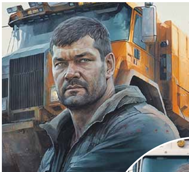
Карьерный самосвал «БелАЗ» - brutalный работника.