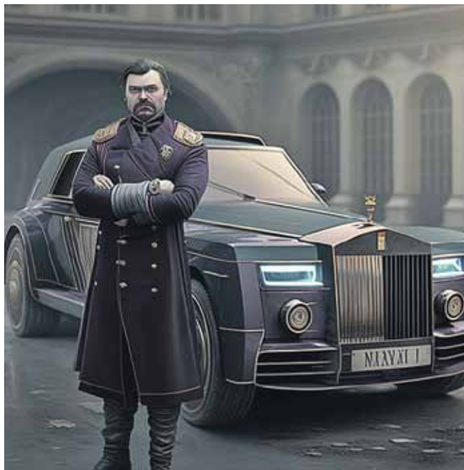
Президентский «Аурус» приобрел императорские черты. Выглядит гламурно и винтажно.

Midjourney на этот раз по заданию «СВ» сгенерировала портреты самых знаменитых автомобилей России и Беларуси. Получилось очень экспрессивно.