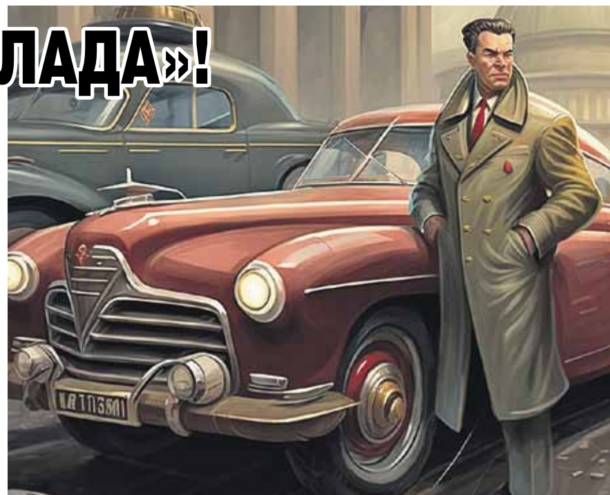
Еще одно ретро - «Победа». Образ суровый, практически недостижимый. Да и антураж Северной столицы вписался очень гармонично.

Если объяснить простыми словами, это работает так: группу данных помещают в нейронную сеть, то есть в заранее построенную сложную математическую модель. Это могут быть научные статьи, литературные произведения, коллекции фотографий. Если предоставить собрание сочинений известных литературных гениев, она должна быть способна сгенерировать собственный текст, похожий на стиль Шекспира. То же самое касается генерации изображений: загрузив в сеть подборку в различных художественных стилях, вы получите новую картинку на основе этих данных.