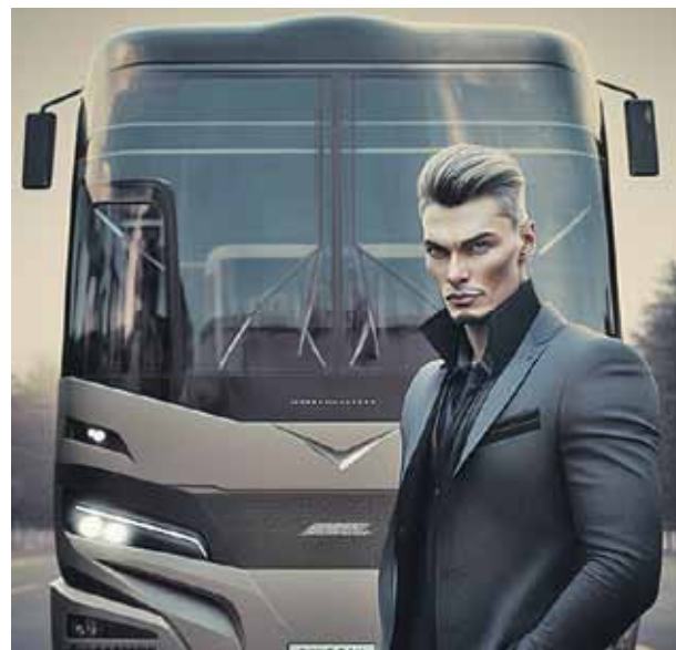
Стильный и современный, от его форм можно потерять голову - таким получился автобус «МАЗ».