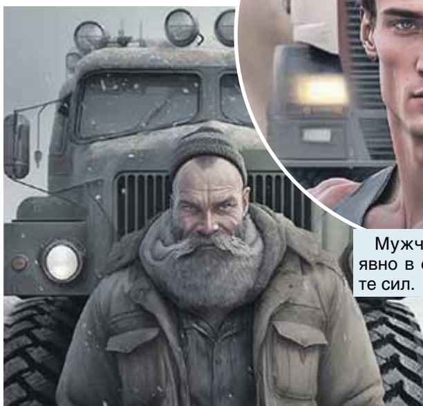
Мужчина-«КамАЗ» явно в самом расцвете сил.