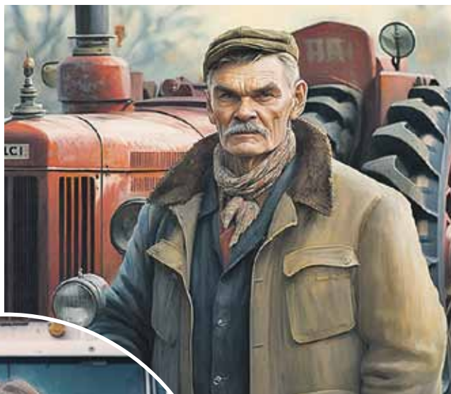
Трактор МТЗ - выдержанный временем и надежный, как скала.