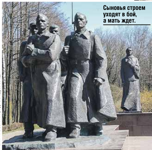
Сыновья строем уходят в бой, а мать ждет.