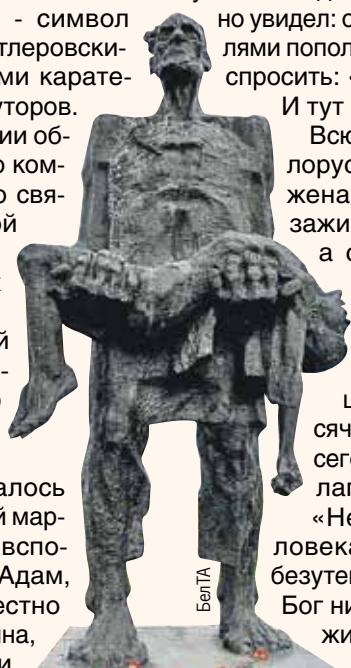
Монумент, разрывающий душу.

Всю боль простого белорусского мужика, чья жена и младшие дети заживо горели в сарае, а старший сын умирал у него на руках, скульптор Сергей Селиханов воплотил в бронзе в конце 1960-х. Сотни тысяч туристов, приезжая сегодня в Хатынь и возлагая цветы к ногам «Непокоренного человека», читают слова безутешного отца: «Не дай Бог никому, кто на земле живет, чтоб не видели и не слышали горя такого...»