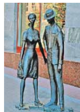
Все как в жизни: мама, папа и куда-то вечно пропадающий ребенок.