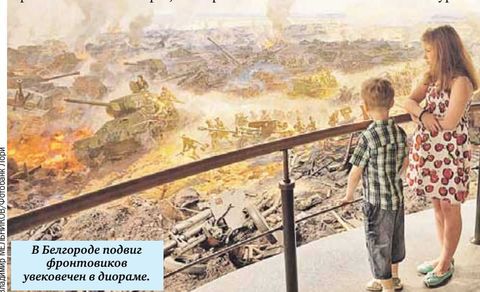
В Белгороде подвиг фронтовиков увековечен в диораме.

Она - один из инициаторов строительства мемориала.