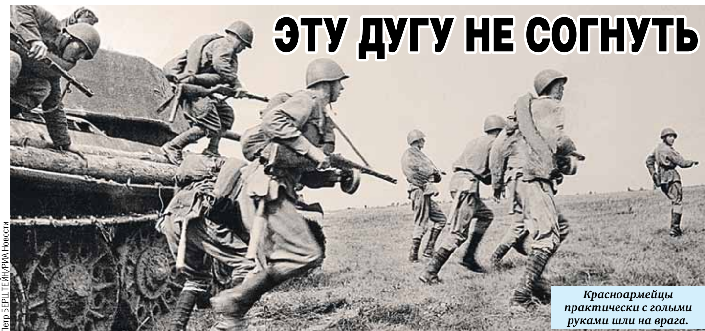
Красноармейцы практически с голыми руками шли на врага.