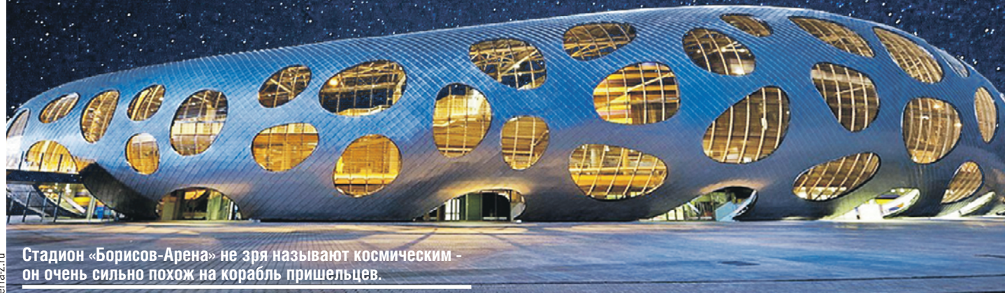
Стадион «Борисов-Арена» не зря называют космическим - он очень сильно похож на корабль пришельцев.

разных стран и проводят масштабную реконструкцию переправы наполеоновских войск.