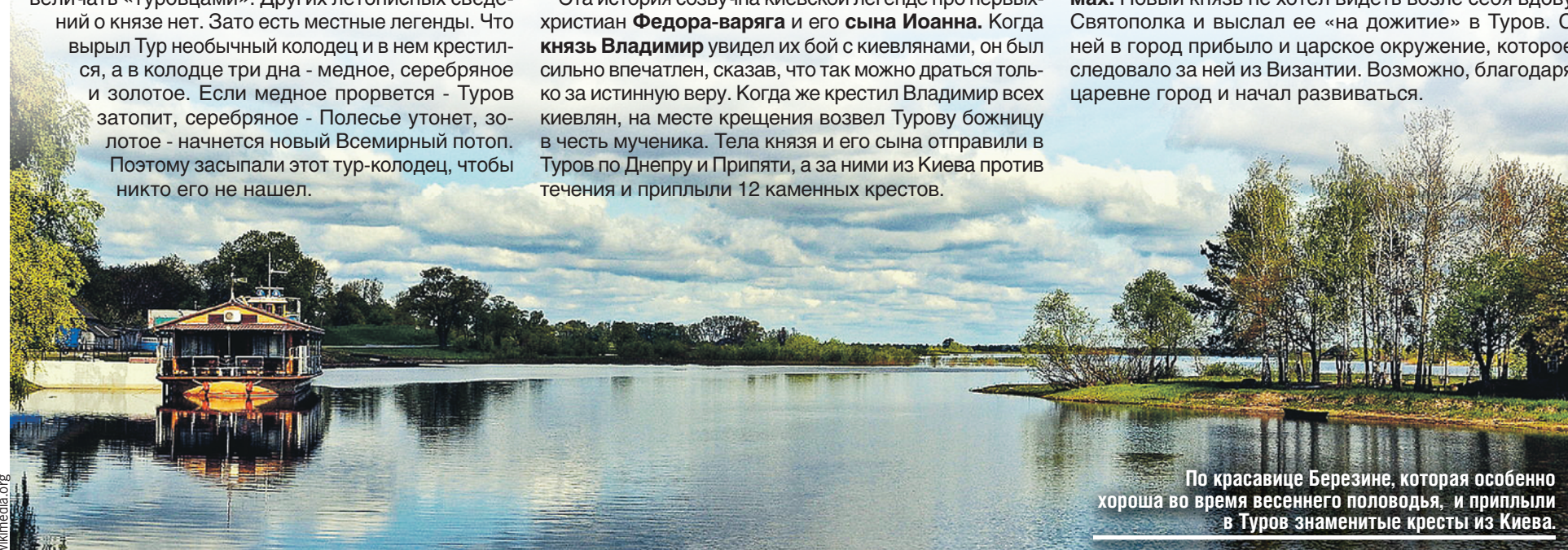
По красавице Березине, которая особенно хороша во время весеннего половодья, и приплыли в Туров знаменитые кресты из Киева.

Эта история созвучна киевской легенде про первых христиан Федора-варяга и его сына Иоанна. Когда князь Владимир увидел их бой с киевлянами, он был сильно впечатлен, сказав, что так можно драться только за истинную веру. Когда же крестил Владимир всех киевлян, на месте крещения возвел Турову божницу в честь мученика. Тела князя и его сына отправили в Туров по Днепру и Припяти, а за ними из Киева против течения и приплыли 12 каменных крестов.