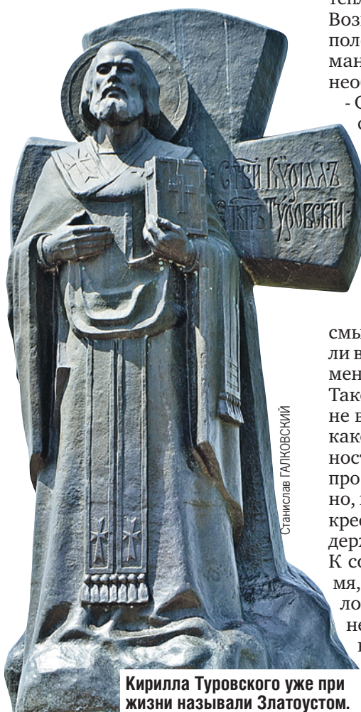
Кирилла Туровского уже при жизни называли Златоустом.

- Молились или желание загадывали? - спросил, когда он «вернулся» в мир.