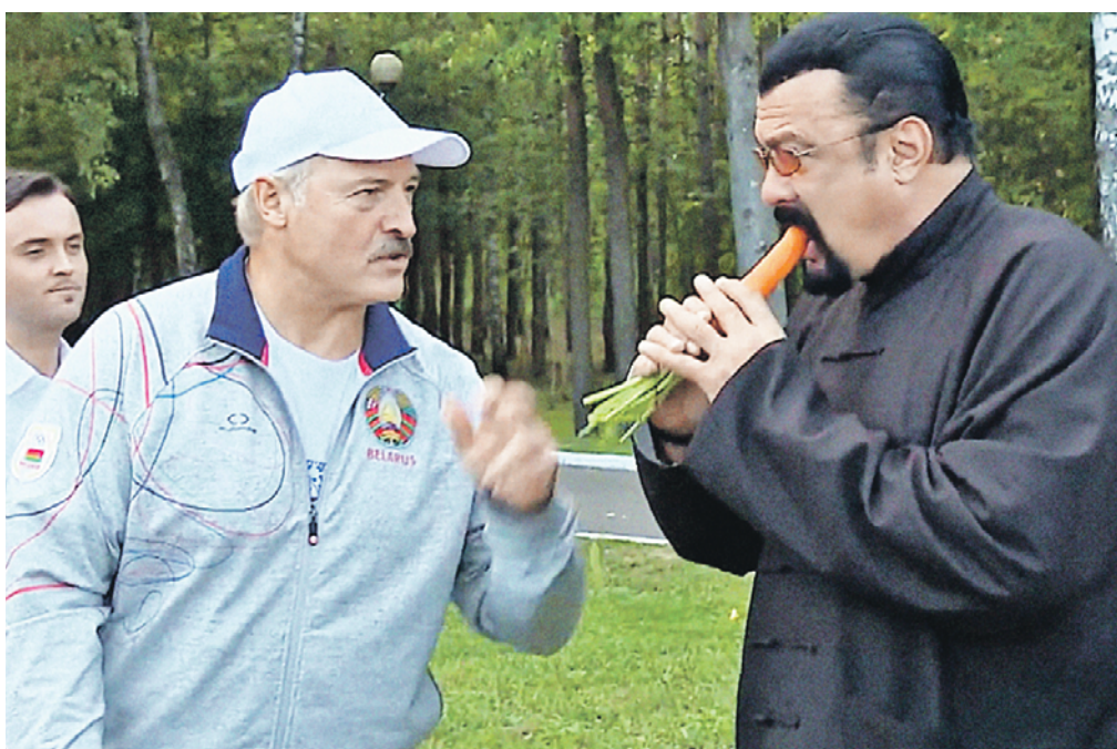
Дегустация прямо с президентской грядки: Александр Лукашенко выдернул морковь, почистил и дал попробовать актеру со словами: «Кушай на здоровье!». Тот с удовольствием захрустел...