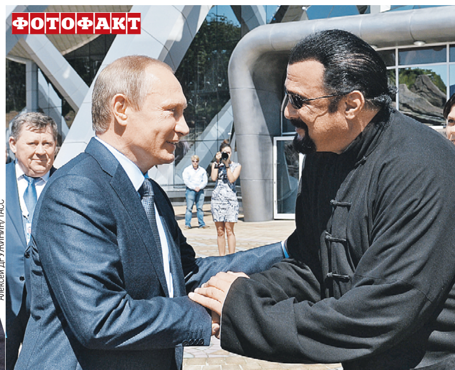
С российским президентом Владимиром Путиным Стивен Сигал тоже познакомился лично. Встреча прошла необычно - в Приморском океанариуме на острове Русский в прошлом году.