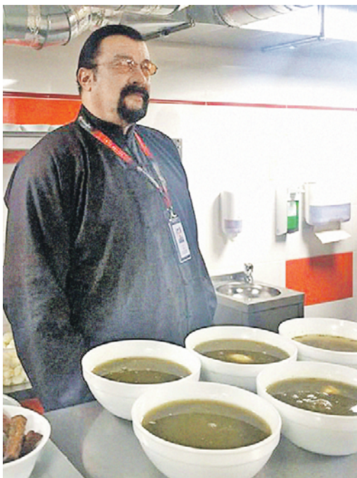
Снова в роли повара Кейси Райбека: американец покормил популярных минских программистов.

- Когда тебе суп наливает Кейси Райбек, то стоит подойти за второй порцией! - шутили сотрудники.