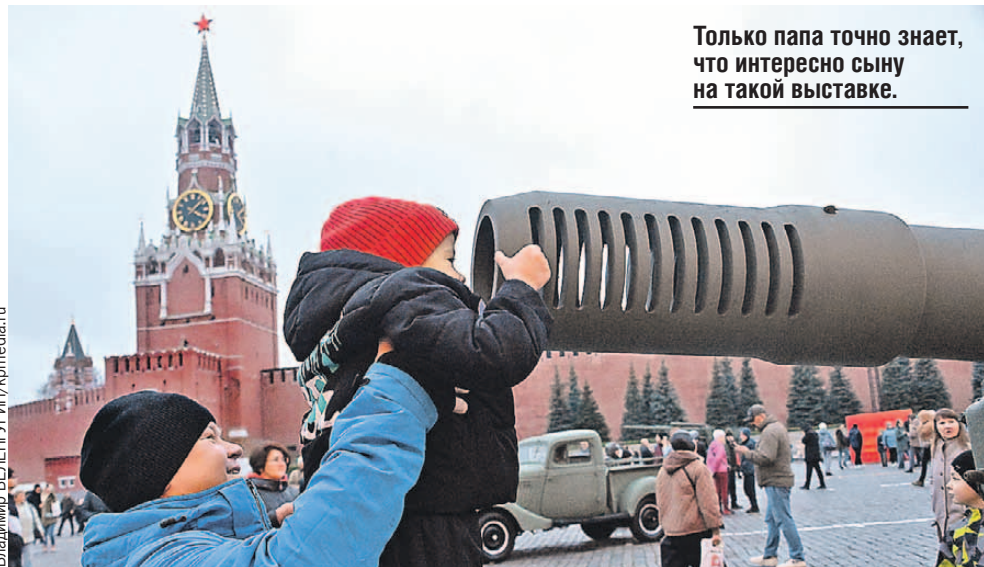
Только папа точно знает, что интересно сыну на такой выставке.