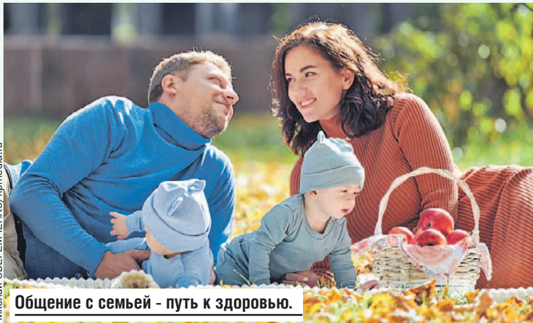
Общение с семьей - путь к здоровью.

- Первое: делайте то, что не вызывает внутреннего сопротивления. Второе правило: перестаньте «копить на потом». Живите сегодня так, как планировали на пенсии. Большинство людей откладывают жизнь на