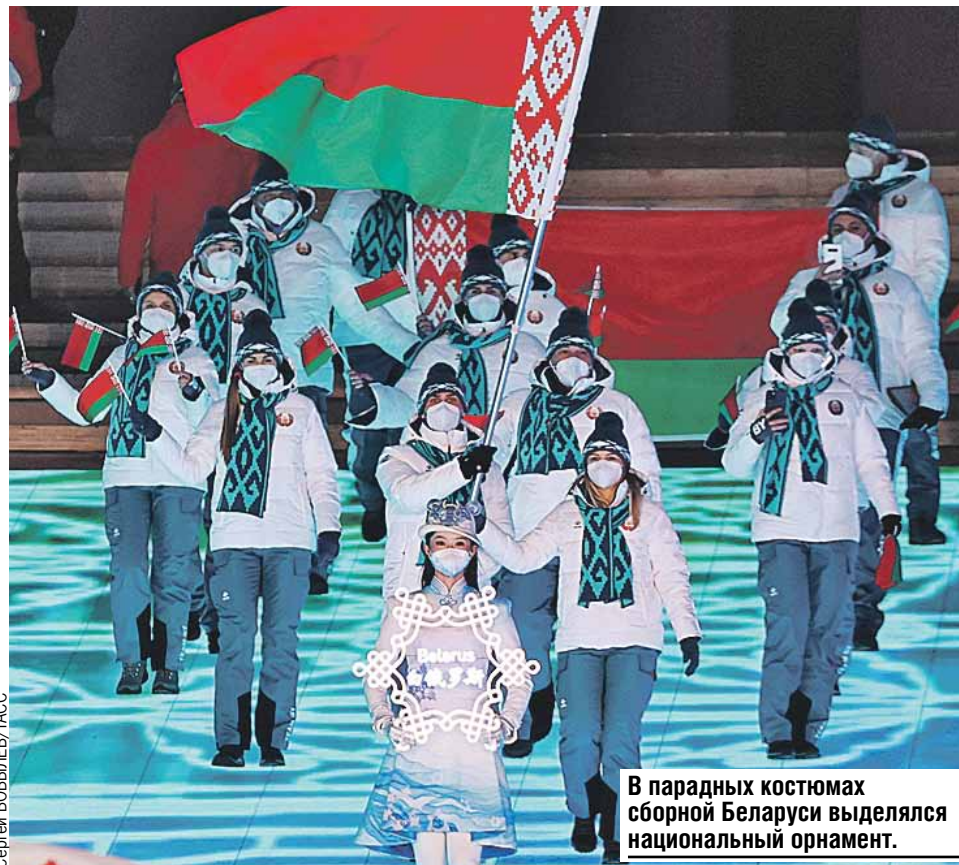
В парадных костюмах сборной Беларуси выделялся национальный орнамент.