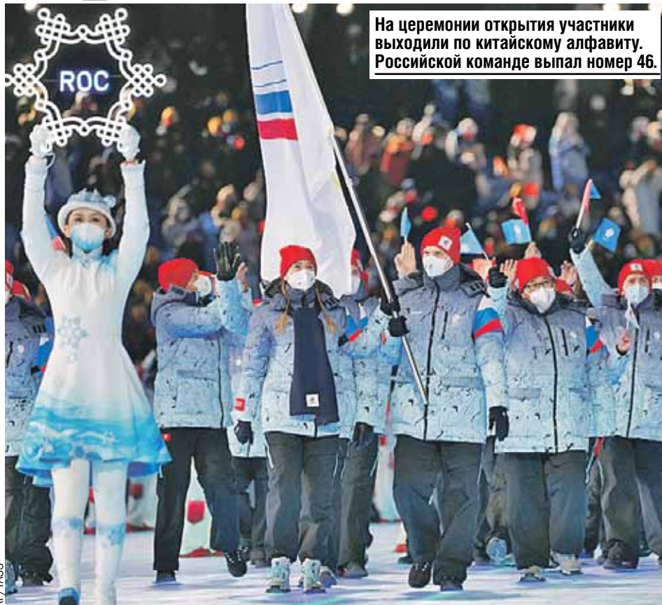
На церемонии открытия участники выходили по китайскому алфавиту. Российской команде выпал номер 46.