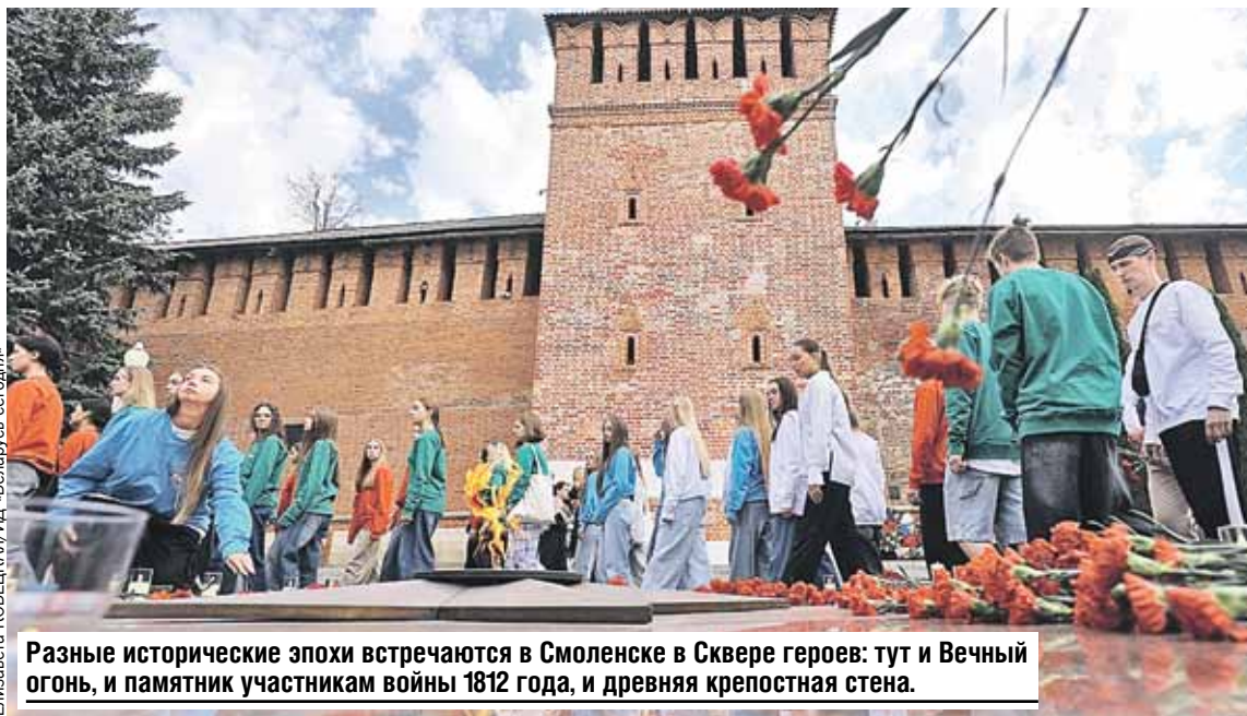
Разные исторические эпохи встречаются в Смоленске в Сквере героев: тут и Вечный огонь, и памятник участникам войны 1812 года, и древняя крепостная стена.

Госсекретарь Союзного государства Дмитрий Мезенцев напомнил, что в последнее время в два раза увеличили число патриотических мероприятий.