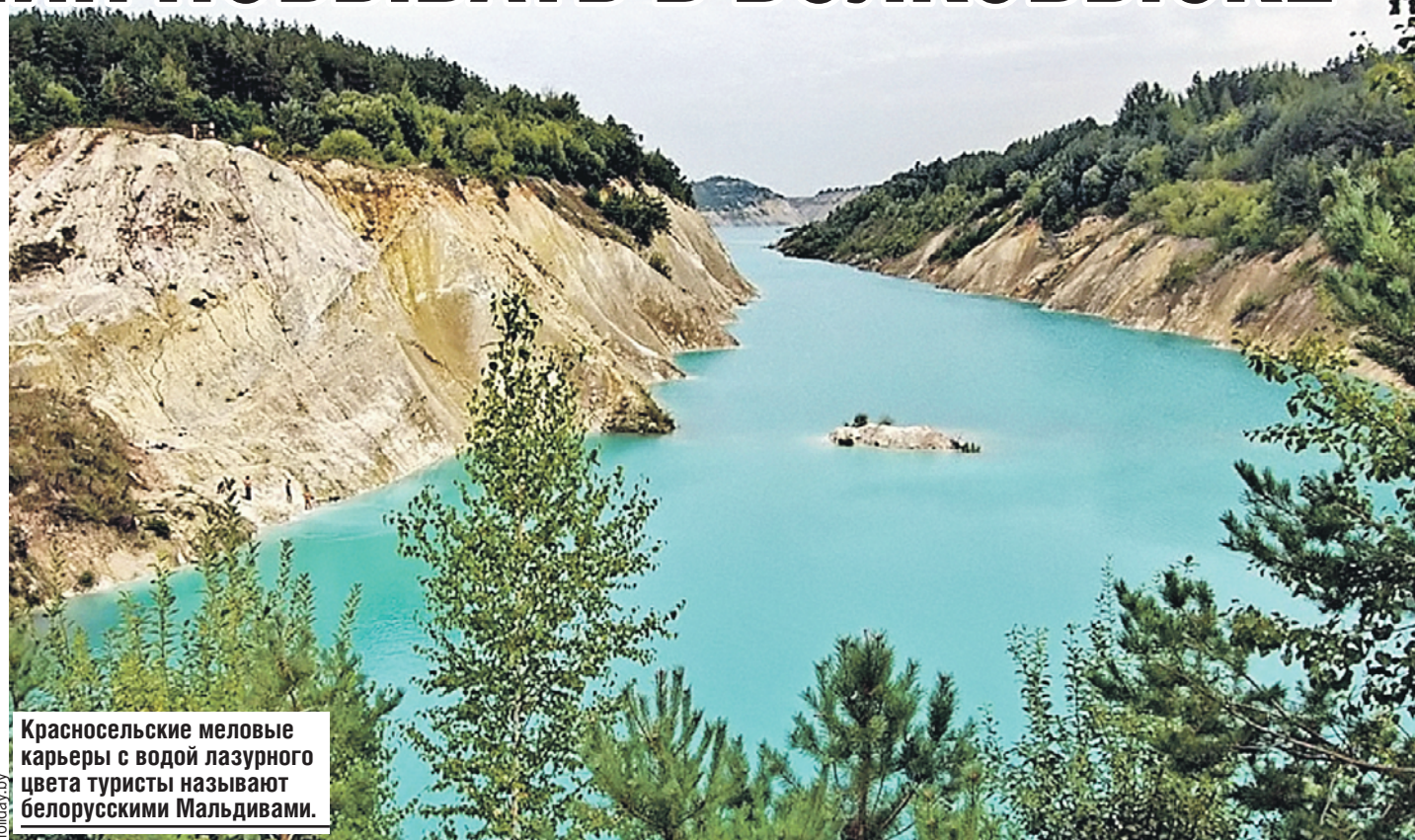
Красносельские меловые карьеры с водой лазурного цвета туристы называют белорусскими Мальдивами.

С чего вдруг Шведская? Говорят, что гора появилась во время одной из европейских войн XVI - XVIII веков - шведы с помпой похоронили своего полководца. Какие шведы, какого полководца? Историки бьются над разгадкой. Археологи же утверждают: древние люди жили на холме за несколько сотен лет до этих событий.