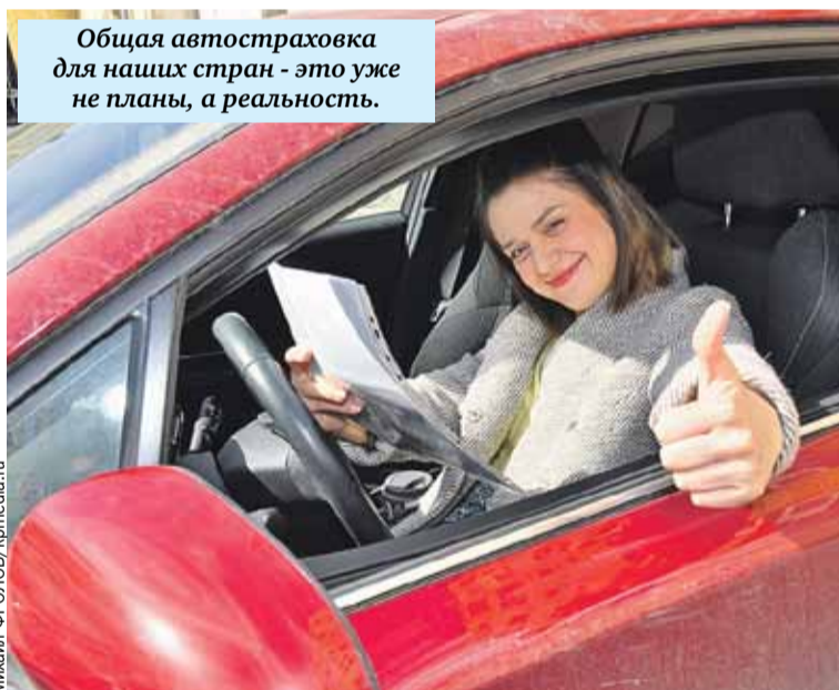
Общая автостраховка для наших стран - это уже не планы, а реальность.