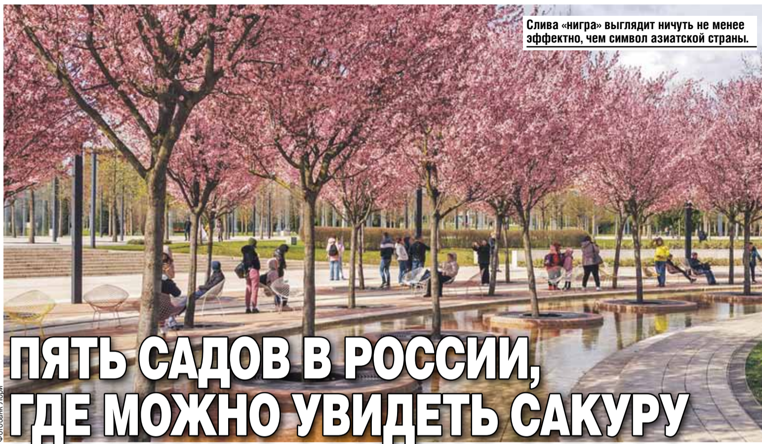
Слива «нигра» выглядит ничуть не менее эффектно, чем символ азиатской страны.

Сам парк появился относительно недавно - в 2017 году. Кроме сливы «нигра» там можно увидеть клены, тополя и дубы. Есть и более редкие растения - тюльпановые деревья, бонсаи, туи, оливы, чилийские сосны и растущие в форме скамеек платаны, на которых можно сидеть. Общая площадь озеленения - около двадцати гектаров. Есть плоскостные фонтаны и лабиринт зеркальных клумб с камелиями.