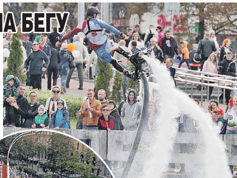
Водные выкрутасы на Свислочи произвели впечатление на публику.

Впрочем, некоторые не забыли, что у города праздник, и превратили спортивное мероприятие в настоящий карнавал - на столичных улицах можно было встретить лису Алису и кота Базилио, Аладди-