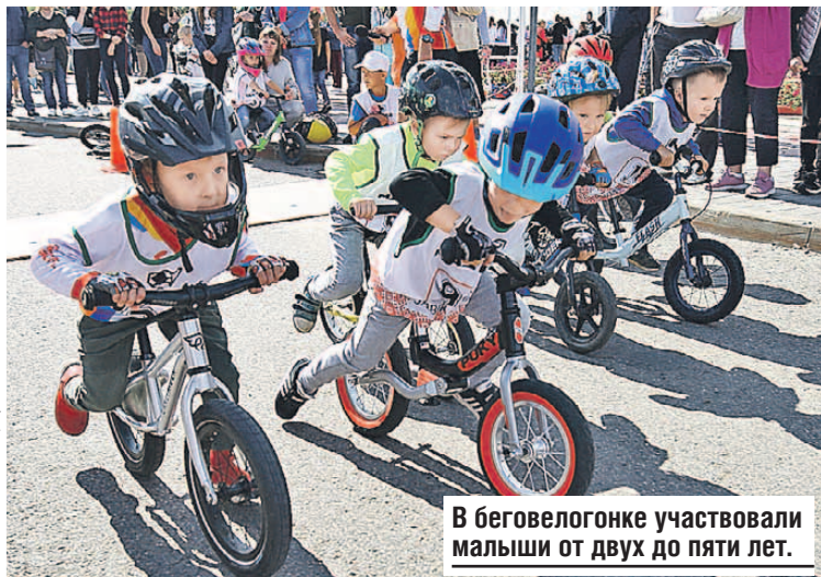
В беговелогонке участвовали малыши от двух до пяти лет.

на и Жасмин, Человека-паука и Джокера. Не упали лицом в грязь и болельщики, которые подготовили для бегунов забавные плакаты: «Сын маминной подружки давно финишировал», «Усталость пройдет, фото в Инстаграме останутся». К основным дистанциям в этом году добавился и детский забег на пятьсот метров. На старт вышли даже мамы с колясками!