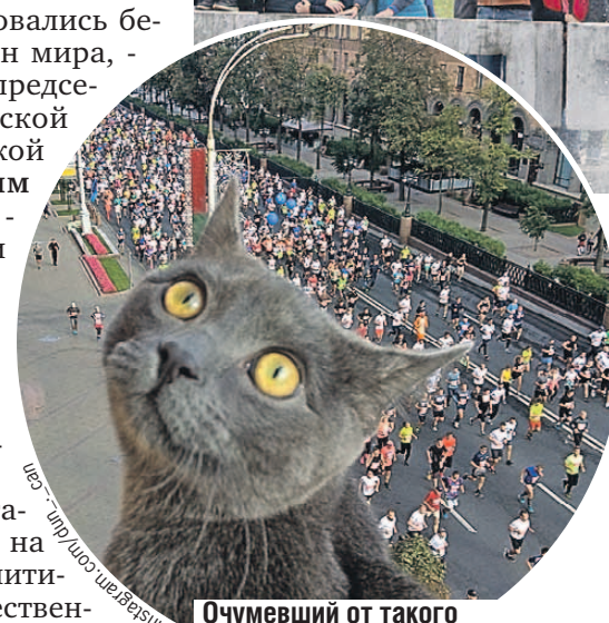
Очумевший от такого количества марафонцев кот Дункан стал героем интернета.

на и Жасмин, Человека-паука и Джокера. Не упали лицом в грязь и болельщики, которые подготовили для бегунов забавные плакаты: «Сын маминной подружки давно финишировал», «Усталость пройдет, фото в Инстаграме останутся». К основным дистанциям в этом году добавился и детский забег на пятьсот метров. На старт вышли даже мамы с колясками!