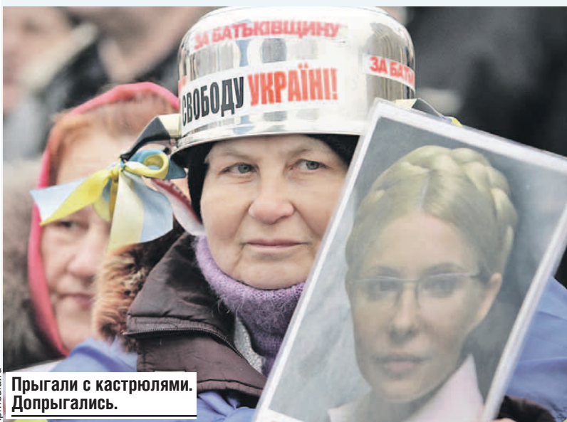
Прыгали с кастрюлями. Допрыгались.

Это тоже не нужно. Поэтому куда его устроить? Куда ты будешь с этими вещами его помещать?