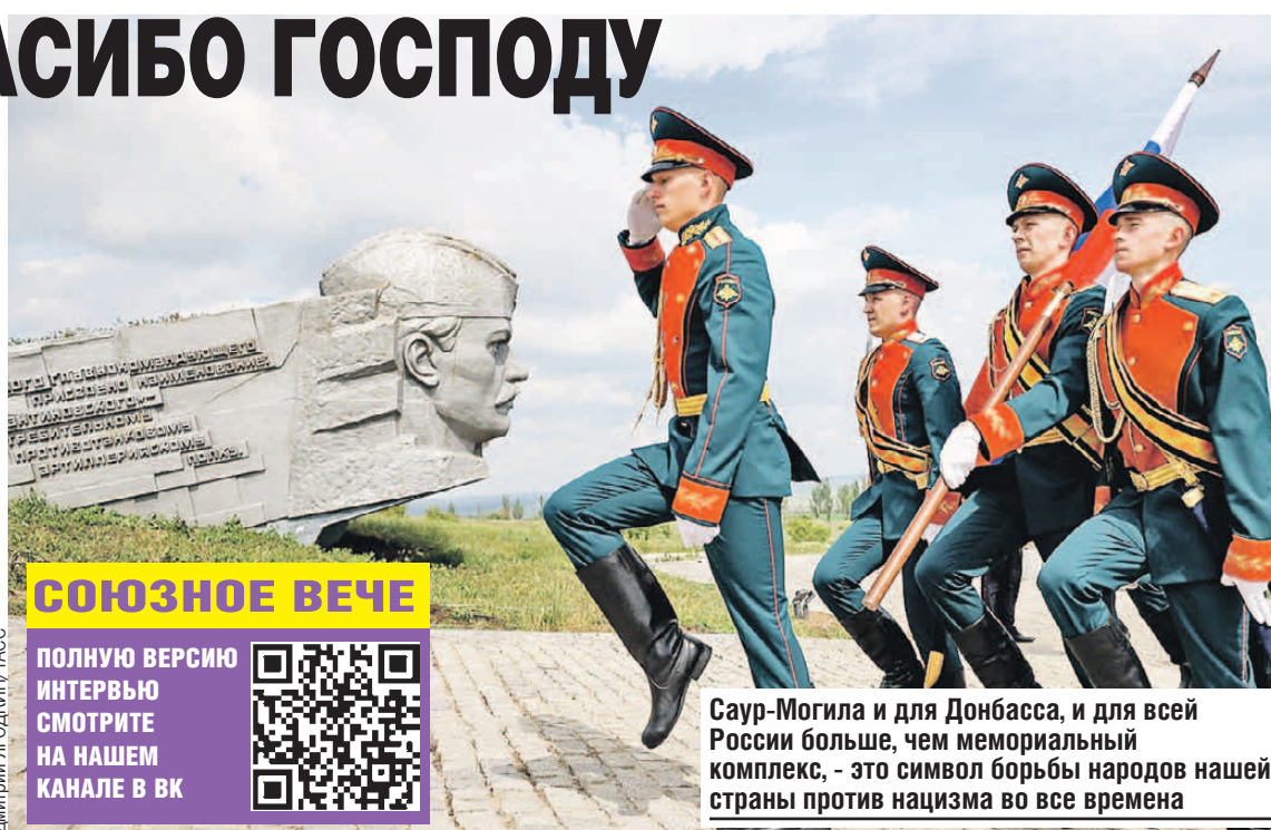
Саур-Могила и для Донбасса, и для всей России больше, чем мемориальный комплекс, - это символ борьбы народов нашей страны против нацизма во все времена

Они продолжают работу, я абсолютно убежден, что наши заклятые партнеры делают на них ставку. Они понимают, что у них либералы поломались, буржуазия поломалась, новых навалыстов не будет, что это совершенно маргинальный спектр нашего политического поля. Поэтому они будут ставить на радикальных антисоветских националистов и здесь, и, по возможности, в Беларуси, если наметятся хоть какие-то перспективы. И этот поединок не закончился.