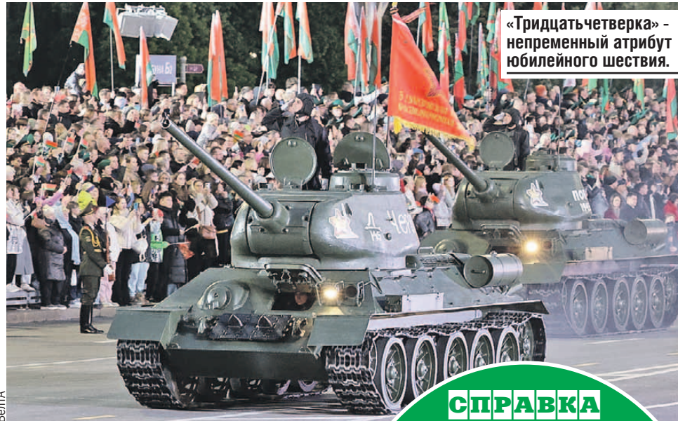
«Тридцатьчетверка» - непременный атрибут юбилейного шествия.