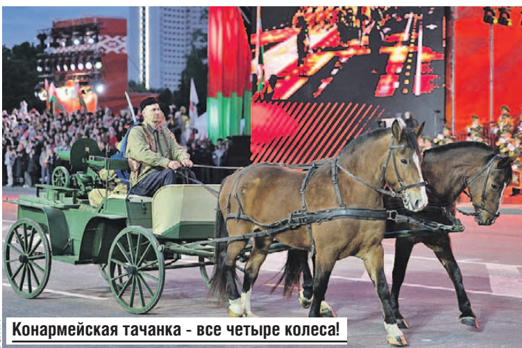
Конармейская тачанка - все четыре колеса!

➤ Больше четырех тысяч военно-служащих и около 250 единиц техники участвовали в параде в Минске. ➤ В составе парадных расчетов чеканили шаг не только белорусские военнослужащие, но и представители Вооруженных сил России, Народно-освободительной армии Китая, знаменные группы от ВС Азербайджана, Казахстана, Кыргызстана, Таджикистана и Узбекистана.