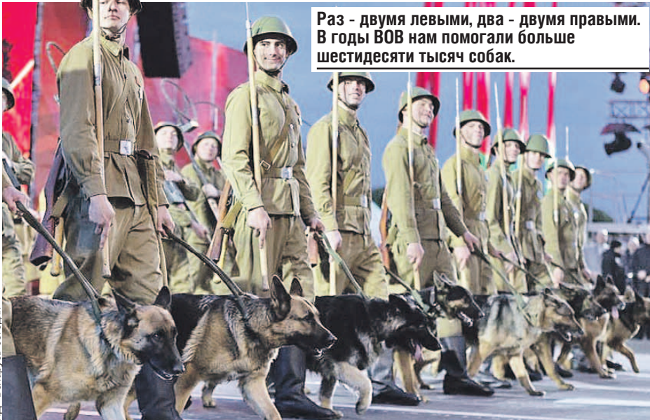
Раз - двумя левыми, два - двумя правыми. В годы ВОВ нам помогали больше шести десяти тысяч собак.