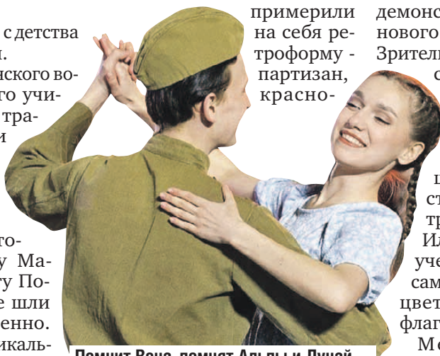
Помнит Вена, помнят Альпы и Дунай тот цветущий и поющий яркий май.