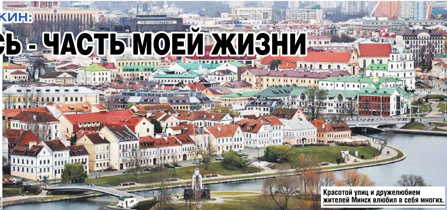
Красотой улиц и дружелюбием жителей Минск влюбил в себя многих.

Я люблю носить только натуральные шубы. Я никогда не надену кирзу - лучше буду ходить босиком. А то, что сейчас вместо искусства порой