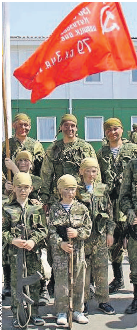
В открытии военного городка для 150-й мотострелковой дивизии поучаствовали и юные спортсмены Регионального отделения ДОСААФ России Ростовской области.

За освобождение Бреста бригада получила орден Красного Знамени. А потом был Берлин. Первыми на улицы германской столицы 22 апреля 1945 года ворвались танки 1-го механизированного корпуса. Среди них были машины 19-й Слонимско-Померанской бригады. До Победы оставался последний бросок.