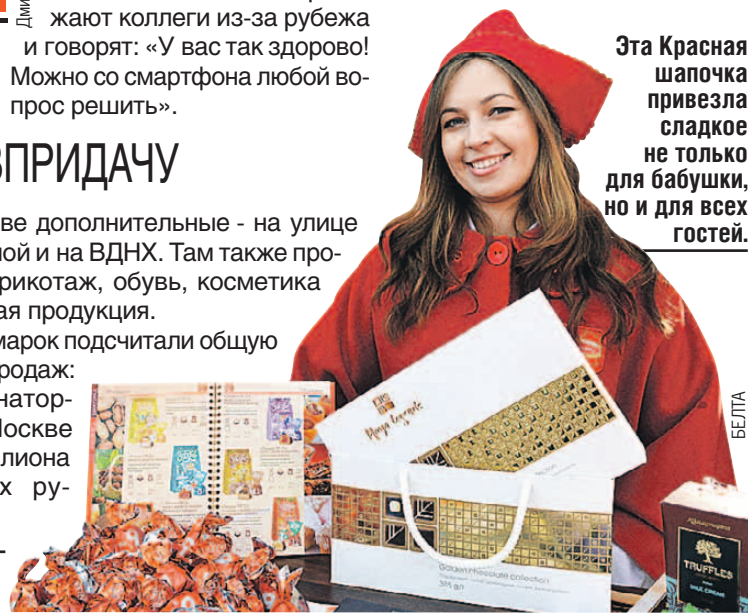
Эта Красная шапочка привезла сладкое не только для бабушки, но и для всех гостей.