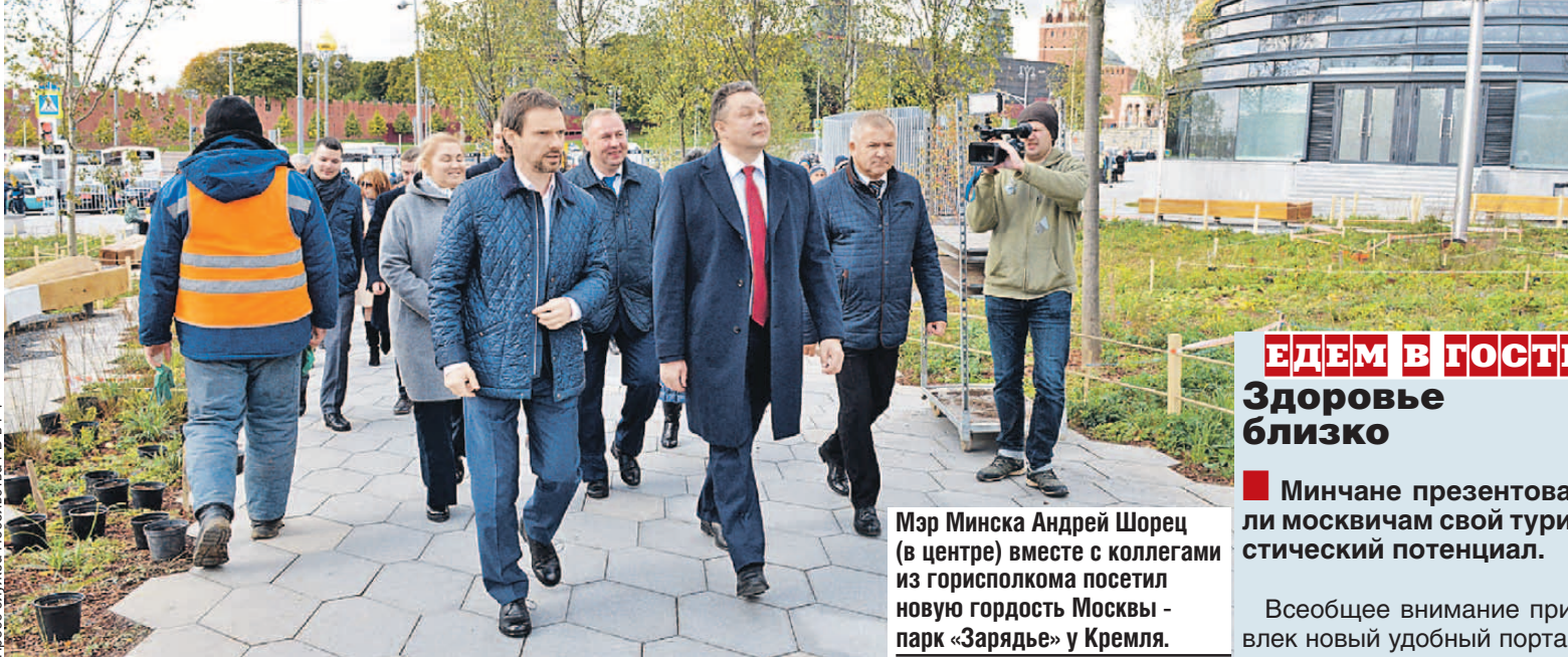
Мэр Минска Андрей Шорец (в центре) вместе с коллегами из горисполкома посетил новую гордость Москвы - парк «Зарядье» у Кремля.