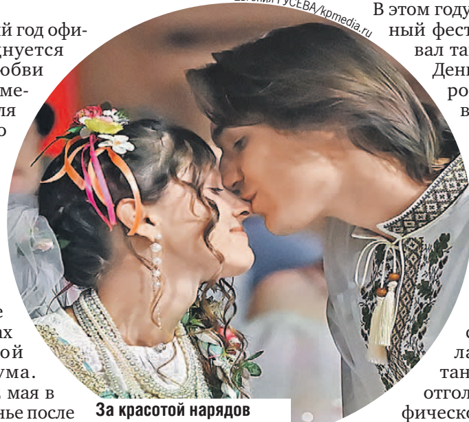
За красотой нарядов чувства не прятались.

В этом году яркий свадебный фестиваль стартовал там же, но уже в День Петра и Февронии. И назывался «Россия. Соединяя сердца». Во время фестиваля 206 пар создали семью. Меньше, чем годом ранее, но, увы, отражение общей тенденции к снижению числа бракосочетаний в стране - отголоски демографической ямы 1989 - 2002 годов.