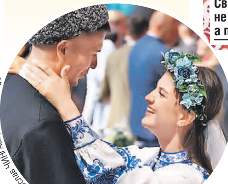
Больше двухсот пар на фестивале зарегистрировали браки.