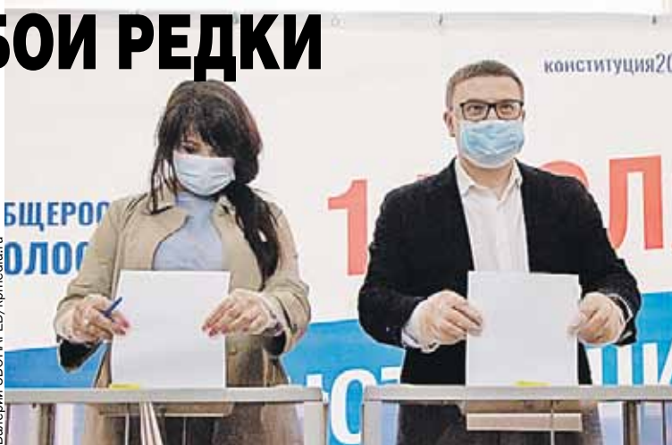
При проведении конституционной реформы в Синеокой взяли на вооружение российский опыт.

юзного государства, направленную на устранение административных барьеров и создание равноправных условий как для бизнеса, так и для граждан.