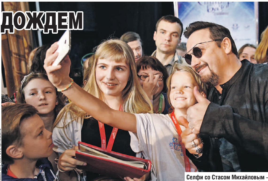
Селфи со Стасом Михайловым - отличный «сувенир» из Витебска.

Этот приезд получился особенно приятным. Певица получила награду из рук Президента Беларуси Александр Лукашенко (подробнее на стр. 2). А спустя несколько часов имя Гвердцители появилось на витебской Площади звезд. Рядом уже отметились Алла Пугачева, София Ротару, Эдита Пьеха, Лев Лещенко, Валерий Леонтьев и другие артисты.