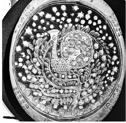
Александр Головин. «Жар-птица»