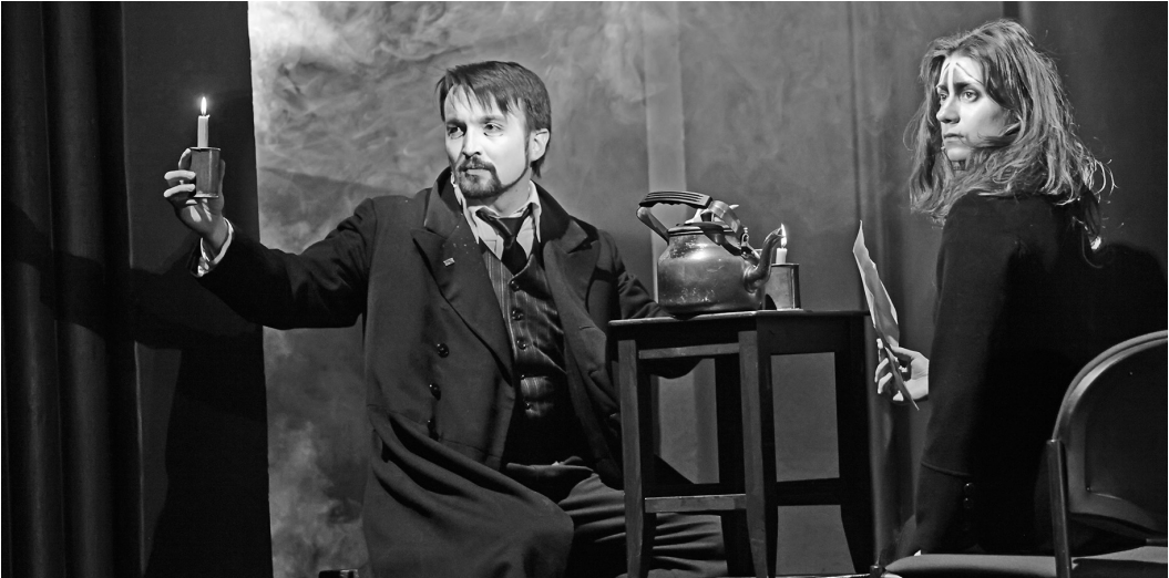
Сцена из спектакля «Бег»