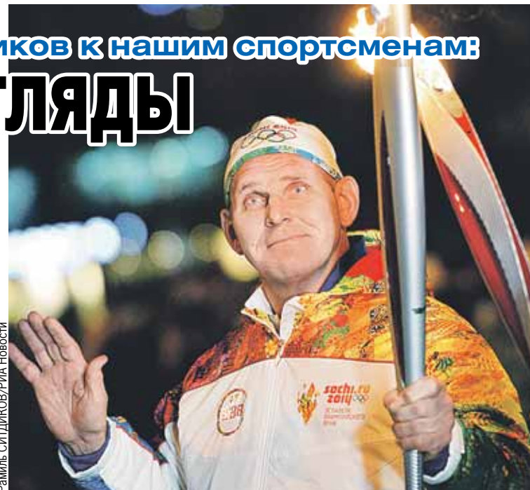
Атлет был знаменосцем нашей команды на трех Олимпиадах подряд - в Сеуле-1988, Барселоне-1992 и Атланте-1996. И везде неизменно брал «золото». И на играх в Сочи-2014 пронес по стадиону факел с драгоценным огнем.

- Когда суммы спонсорских контрактов громадны, а альтернативных источников не существует, возникает огромная зависимость. Есть система распределения средств,