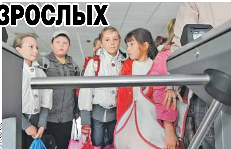
Видеонаблюдение, турникеты, системы распознавания - безопасность прежде всего.

ЗА ПАРТЫ СЯДУТ 1 МИЛЛИОН 85 ТЫСЯЧ ШКОЛЬНИКОВ. ИЗ НИХ 118 ТЫСЯЧ - ПЕРВОКЛАШКИ. ЭТО ПРИМЕРНО НА ТРИ ТЫСЯЧИ БОЛЬШЕ, ЧЕМ В ПРОШЛОМ ГОДУ.