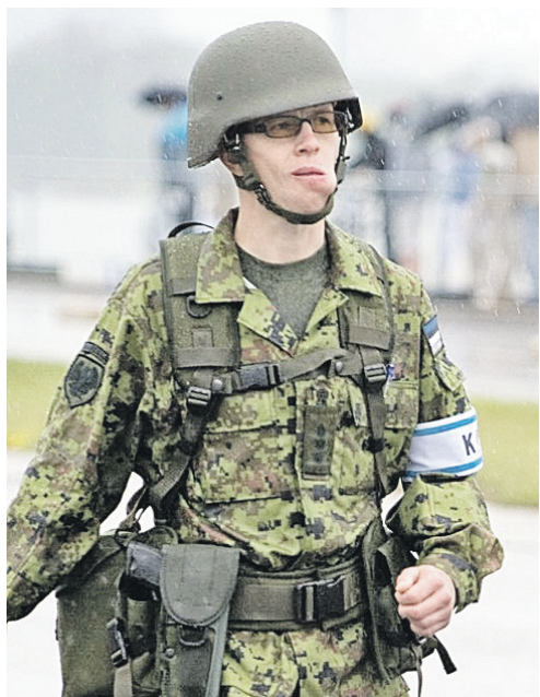
Прибалтика пригрозила, что готова послать вот такие войска в Незалежную. Страшно, аж жуть!

Раскрыл рот и министр обороны еще недавно нейтральной Швеции Пол Йонсон.