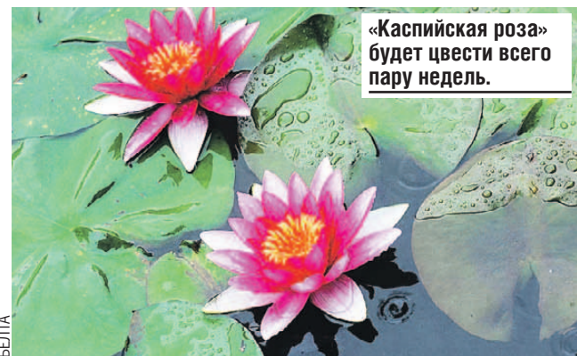
«Каспийская роза» будет цвести всего пару недель.

Финальный аккорд путешествия - увидеть цветущие лотосы. Этот изумительный по красоте и аромату цветок признан символом региона. В этом году бутоны «каспийской розы» появились на две недели позже обычного - в конце июля. Увидеть редкую диковинку можно в авандельте Волги на Дамчикском участке Астраханского заповедника, а также в хорошо прогретых заводях.