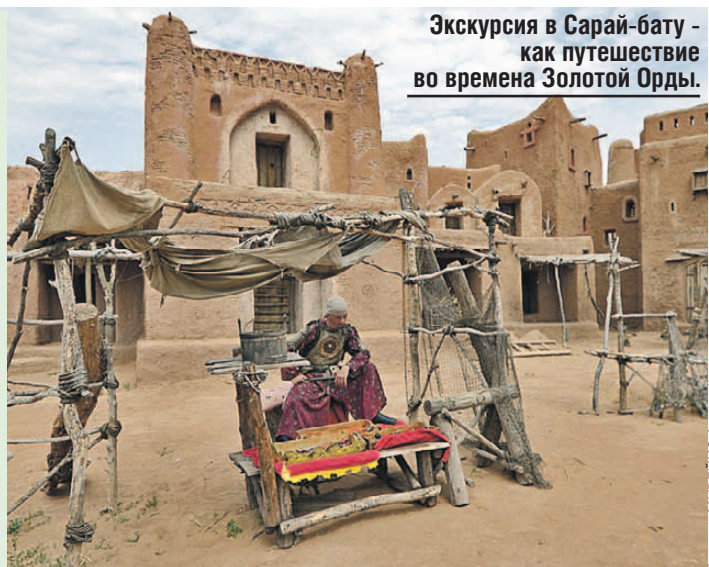
Экскурсия в Сарай-бату - как путешествие во времена Золотой Орды.

Здесь нет закрытых дверей и все можно трогать руками. Зайти в юрту степняков. Побывать в жилище шамана. Даже сфотографироваться в костюме ордынского колдуна. Правда, говорят, это дурной знак - духи шаманов не любят, когда в них играют. В кафе предлагают полное меню кочевников: шашлык, плов и шурпа из свежего барашка.