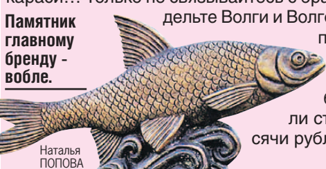
Памятник главному бренду - воле.

Астраханская рыбалка - как магическое заклинание для заядлых любителей. Хоть раз в жизни ее должен попробовать каждый. Огромные осетры, лещи, судаки, караси... Только не связывайтесь с браконьерами - в дельте Волги и Волго-Ахтубинской пойме пруд пруди легальных рыболовных баз. День ловли стоит около тысячи рублей.