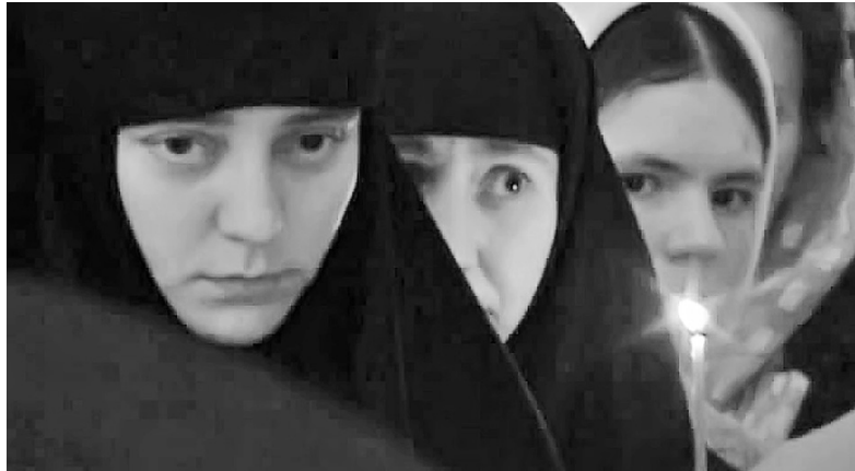
Кадр из фильма «Инокия»

«Доброе кино возвращается» – под таким девизом в Киноцентре на Красной Пресне прошел VIII Международный благотворительный кинофестиваль «Лучезарный ангел»