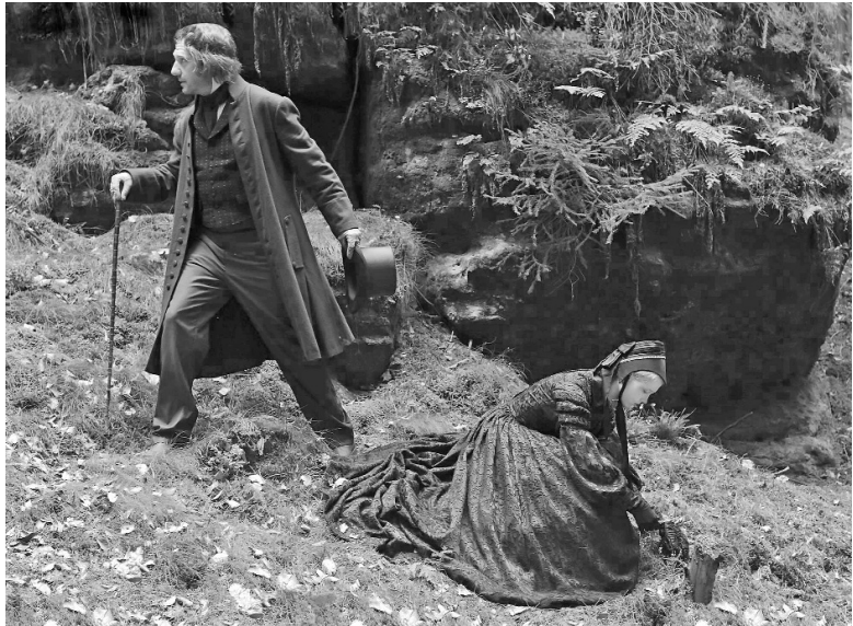
Кадр из фильма «Фауст»

Гран-при V Фестиваля российских фильмов «Спутник над Польшей» получил «Фауст» Александра Сокурова