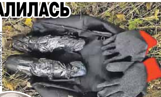
В арсенале экстремистов обнаружили рюкзак с горючей смесью.

Готовила провокацию неформальная организация BYPOL, признанная террористической в республике вместе с так называемым переходным кабинетом белорусской оппозиции, скрывающейся за границей. Некоторые