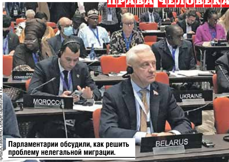
Парламентарии обсудили, как решить проблему нелегальной миграции.