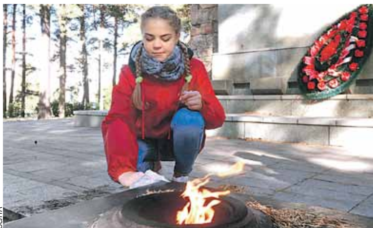
В планах у активистов привести в порядок больше сотни мемориалов и воинских захоронений.

Инициатив у молодых набралось немало. Оренбуржцы за минувший год провели с десяток мероприятий и в социальной сфере, и в здравоохранении, и в области туризма. Особенно они гордятся международным молодежным фестивалем «Евразия Global» (город расположен на стыке Европы и Азии). В сентябре он пройдет в шестой раз. За всю историю существования в нем участвовали больше четырех тысяч человек из ста стран. И он один из немногих фестивалей