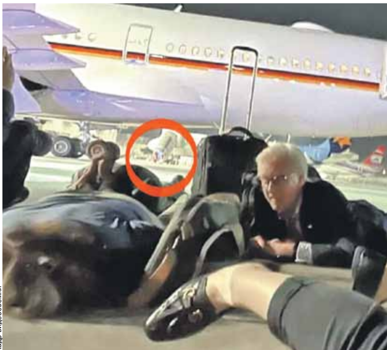
Унылая постановка: Шольц в Тель-Авиве лег на взлетно-посадочную полосу, а на заднем плане люди спокойно садятся в самолет.

Дед мямлит, что помощь Украине не оскудеет, но она уже по факту становится меньше - полноценный американский бюджет так и не приняли. Обольщаться, конечно, не надо - гадостей будет еще предостаточно. Американцы тайно передали Киеву первую партию тактических баллистических ракет АТАСМС. Их уже использовали для ударов по аэродромам в Бердянске и Луганске. Но жалкое шамканье Байдена - символ угасающей мощи «града на холме»: страны, которая с чего-то вдруг решила, что она самая главная на планете.