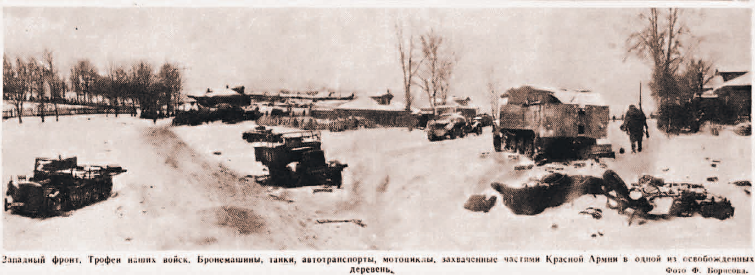
Западный фронт. Трофеи наших войск. Бронемашин, танки, автотранспорты, мотоциклы, захваченные частями Красной Армии в одной из освобожденных деревень.