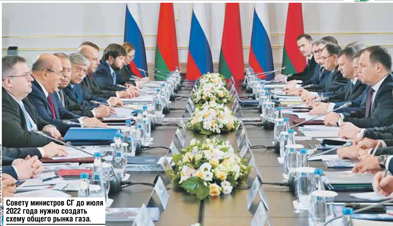
Совету министров СГ до июля 2022 года нужно создать схему общего рынка газа.

Союз наших стран укрепляет государственность и суверенитет. Делает нас сильнее. Однополярный мир рухнул. Беларусь - это крах политики Запада по насильственному изменению политической системы в Европе. Не получилось и не получится! Геополитическая реальность совсем другая. Поэтому санкции и давление ни к чему не приведут. И переговоры будут, и договариваться будут с нами. А у России и Беларуси только один путь - быть сильными, развивать экономику, модернизировать политическую систему и защищать национальные интересы.