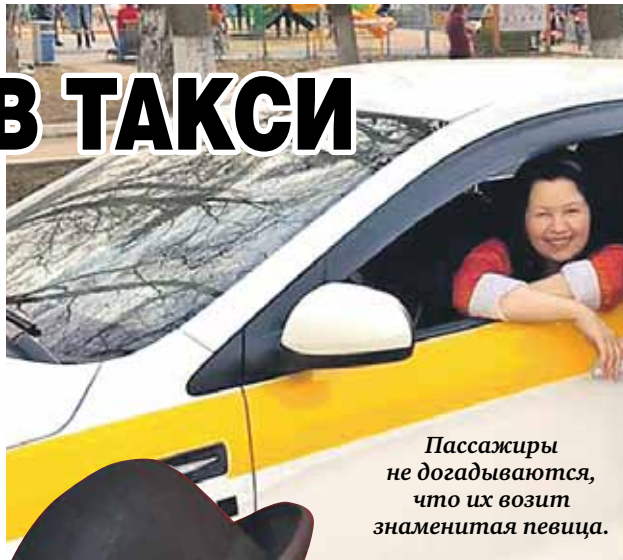
Пассажиры не догадываются, что их возит знаменитая певица.