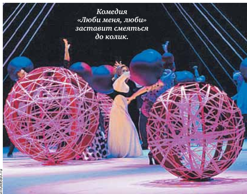
Комедия «Люби меня, люби» заставит смеяться до колик.

«В детстве, как и все люди из прошлого века, я писал короткие слова на заборах, уже тогда понимая, что краткость - сестра таланта. Но гонорары за это не платили, а всыпать могли по первое число. Поэтому постепенно переключился на газеты и журналы. Кабинета никогда не было. Сяду, бывало, в уголок и пишу себе, думая о том, как все же приятно иметь в этой жизни свой угол», - вспоминает писатель.