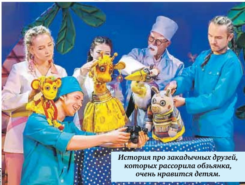
История про закадычных друзей, которых рассорил обезьянка, очень нравится детям.