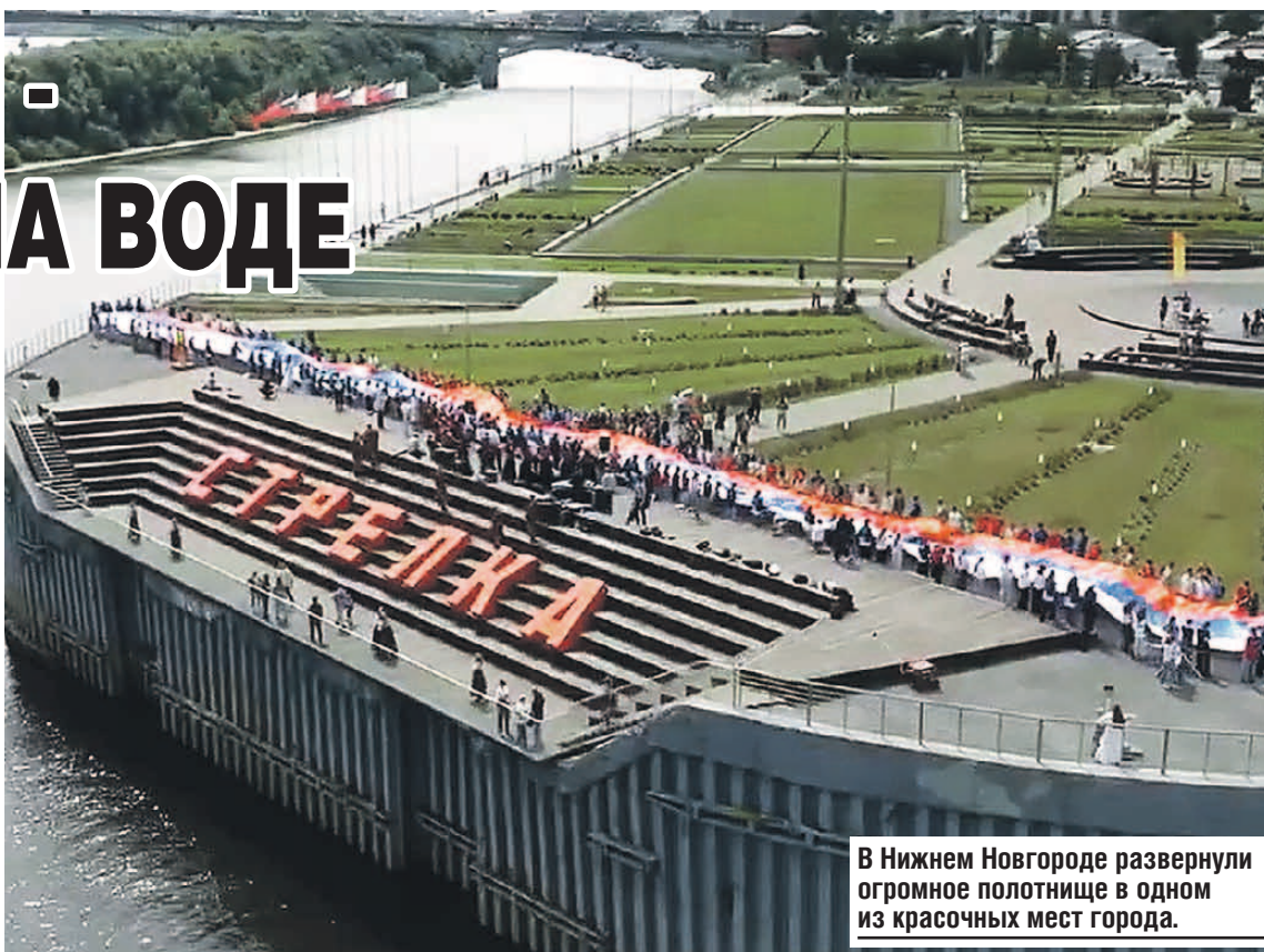
В Нижнем Новгороде развернули огромное полотнище в одном из красочных мест города.

А в Донбассе росгвардейцы вместе с волонтерами раздавали на улицах ленточки в цветах флага. Многие сразу же крепили их к одежде.