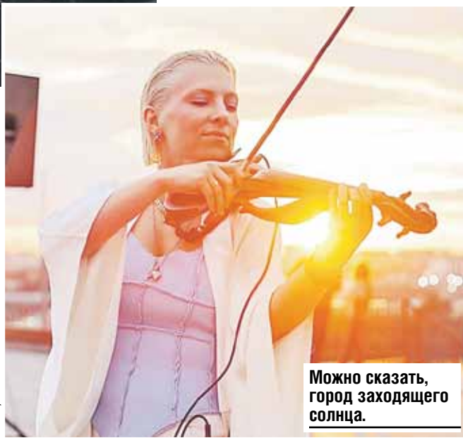
Можно сказать, город заходящего солнца.