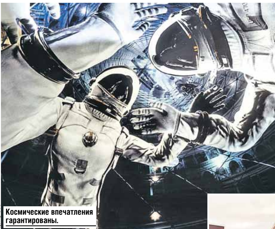
Космические впечатления гарантированы.