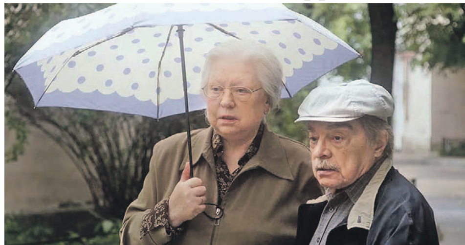
Со Светланой Крючковой в фильме «Двое в одной жизни, не считая собаки» им удалось показать мудрость поколения, пережившего Великую Отечественную войну.