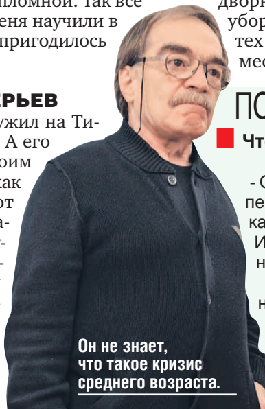
Он не знает, что такое кризис среднего возраста.

Можно окончить какой-нибудь дворничий институт, снегоуборочный факультет, но до тех пор, пока вы несколько месяцев не помажете мет-