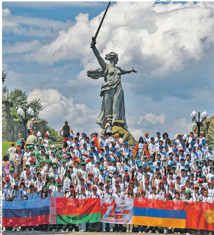
Если регулярно собирать молодых людей там, где их предки совершали подвиги, они никогда не вырастут Иванями, не помнящими родства.

Форум - не только конкурс вокалистов и хореографов. Важным событием станет встреча молодых историков,