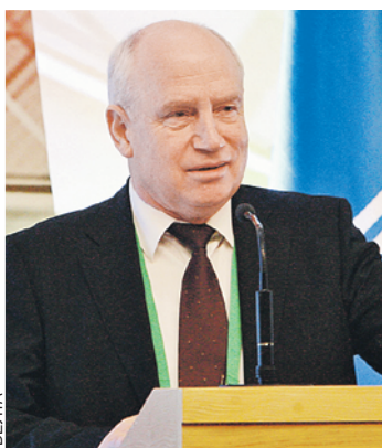
Сергей Лебедев: И через четверть века объединение востребовано.

Всего Экономсовет рассмотрел 16 вопросов и одобрил обширный список документов. Страны продолжают совершенствовать Зону свободной торговли, укрепляют сотрудничество в химической и атомной промышленности, вместе будут развивать инновации, позаботятся о сохранении биоразнообразия.