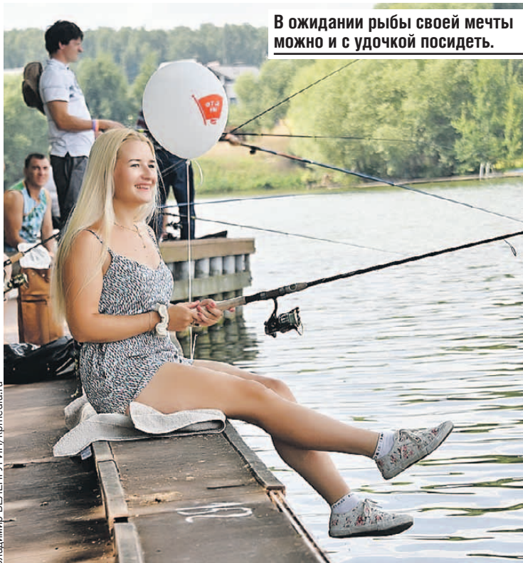
В ожидании рыбы своей мечты можно и с удочкой посидеть.

Всем хорошо известны розы болгарские, крымские... Но и жителям Саратовской области есть чем гордиться. А именно - розами аткарскими. Раньше цветы из этого города украшали улицы и парки Петербурга, Бреста и даже далекой Кубы. В наше время энтузиасты решили вернуть им былую славу и вот уже третий год подряд проводят фестиваль. Откроется он праздничным костюмированным шествием. Появится на «Розовом маскараде» и королева