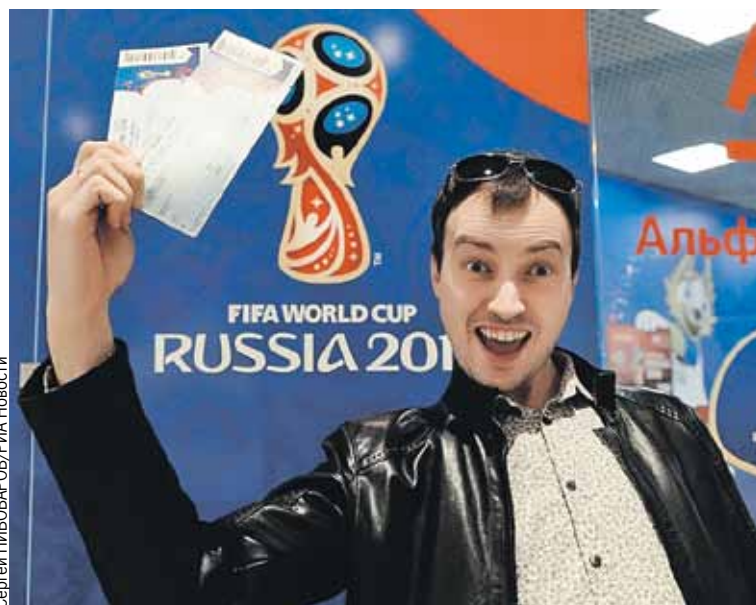
Фанаты, доставшие билеты на игры сборной России, на седьмом небе от счастья.

Друзья правы. Перекупщики ломают в 15 - 20 раз дороже номинала. До нескольких сотен тысяч рублей. Но пролететь можно элементарно. Даже если билет окажется не поддельным, на стадион все равно не пустят. Потому что данные, указанные в билете, будут отличаться от тех, что в паспорте. И прощай - футбол.