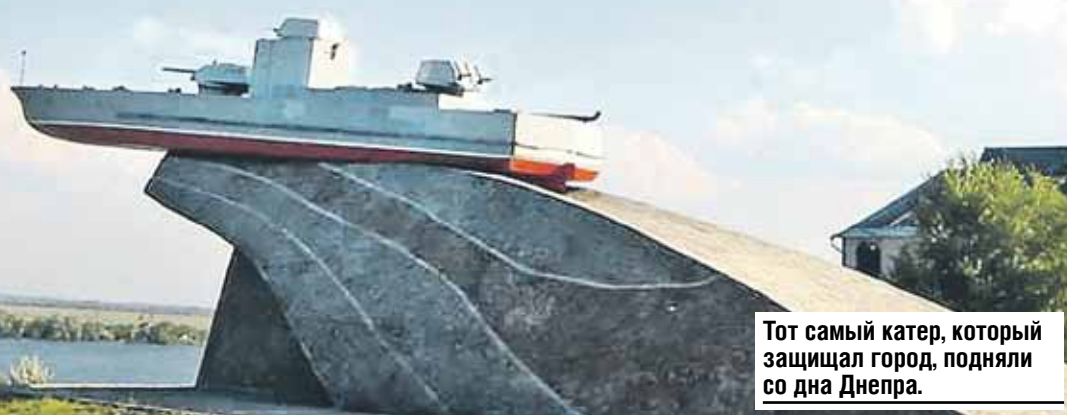
Тот самый катер, который защищал город, подняли со дна Днепра.