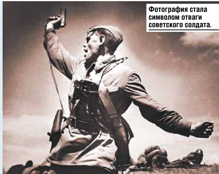
Фотография стала символом отваги советского солдата.

На самом монументе - барельеф со знаменитого снимка «Комбат» фронтового корреспондента Макса Альперта. Того самого, где офицер поднимает бойцов в атаку с криком: «За мной! За Родину! Вперед!». Узнать, кто на фото, удалось только через тридцать