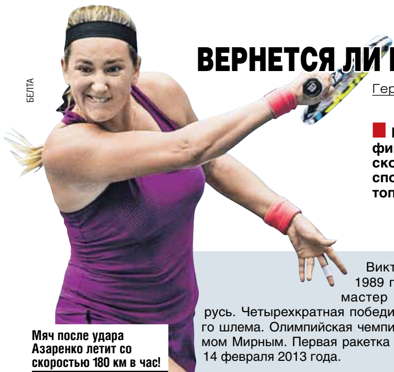
Мяч после удара Азаренко летит со скоростью 180 км в час!

Насколько оправданы ожидания, покажет Australian Open - первый турнир Большого шлема этого сезона, который через неделю стартует в Мельбурне.