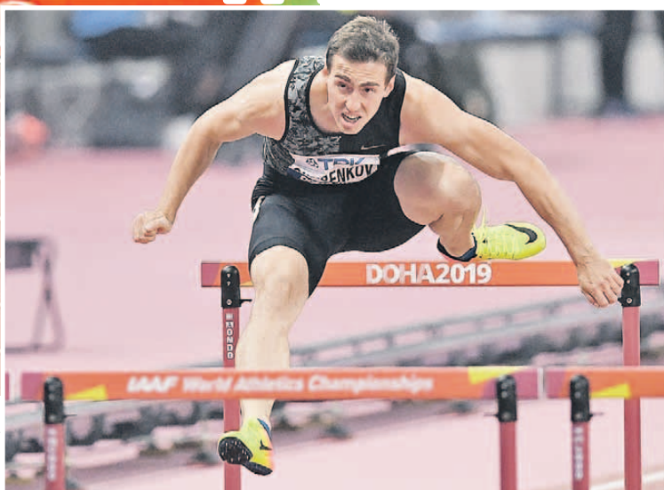
За пару недель планетарного первенства на этапе Бриллиантовой лиги Сергея Шубенкова, запнувшись, сбил с ног Омар Маклауд. Наш барьерист кубарем пересек финиш, но все-таки стал первым (на фото сверху). В Дохе россиянин стартовал в сторонке от ямайца и избежал новой кучи-малы, которую тот опять устроил.