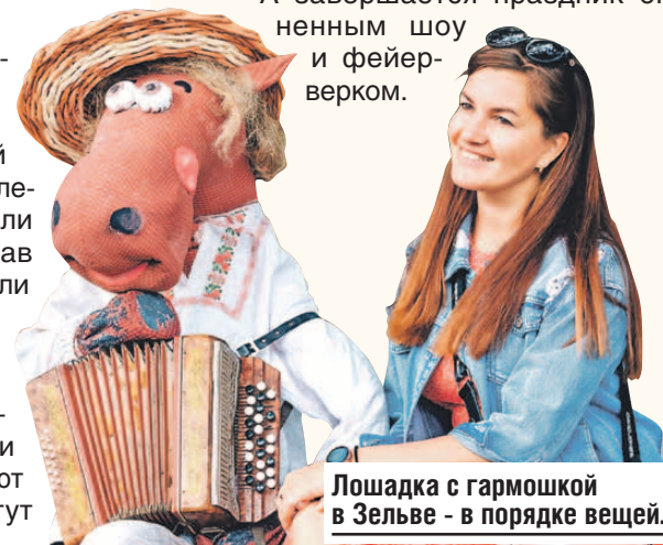
Лошадка с гармошкой в Зельве - в порядке вещей.

Гостей своей выпечкой радуют как профессиональные коллективы, так и любители. Разнообразие хлебных и других изделий в сочетании с вкусной едой, концертами и другими развлечениями никого не оставляют равнодушными. Ну а самые отчаянные могут испечь хлеб сами.