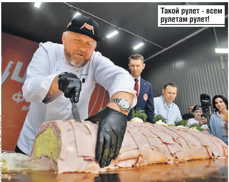
Такой рулет - всем рулетам рулет!

Для гостей, помимо музыки, - лекции о современном искусстве.