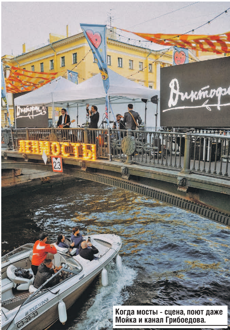
Когда мосты - сцена, поют даже Мойка и канал Грибоедова.