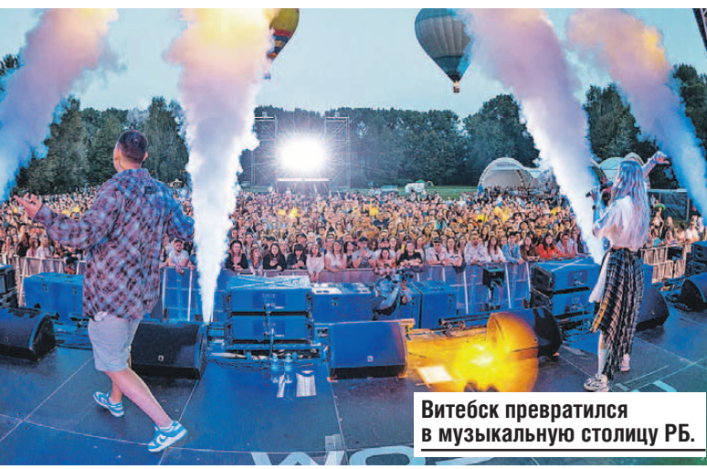
Витебск превратился в музыкальную столицу РБ.

Для вас - зоны активностей, вкусная еда, музыка всех сортов, ну и, конечно, прогулки по Несвижскому дворцово-парковому комплексу.