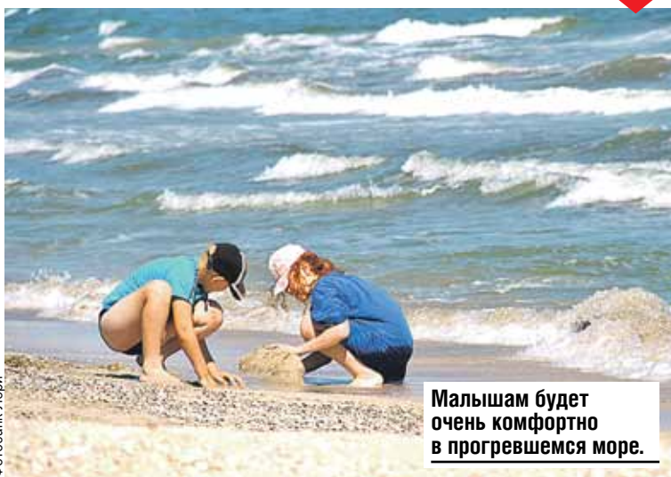
Малышам будет очень комфортно в прогретом море.

Съездите на Должанскую косу. Там прекрасные пейзажи: есть и степи, и леса. На двадцати километрах здесь растянулись ракушечно-песчаные пляжи. Отдыхающих угощают местными рыбными деликатесами.