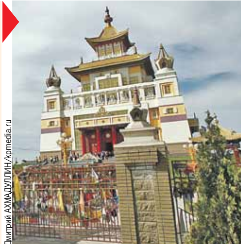
А здесь откровенно жарко. И к тому же можно окунуться в буддийскую культуру.

На столбике термометра в конце весны здесь вполне можно увидеть отметку больше тридцати градусов. Летом жара будет невыносимая, поэтому сейчас отдохнуть там самое время.