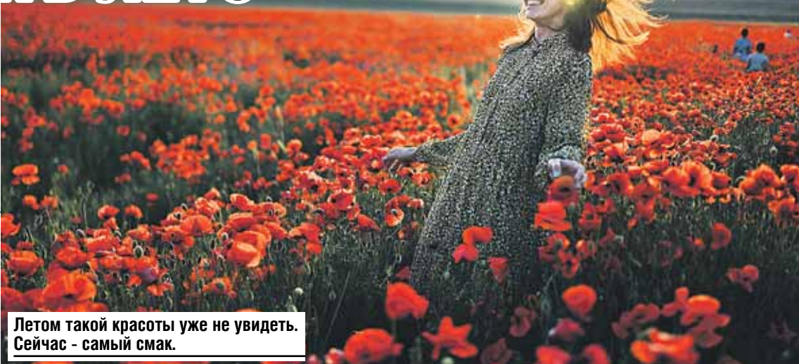
Летом такой красоты уже не увидать. Сейчас - самый смак.