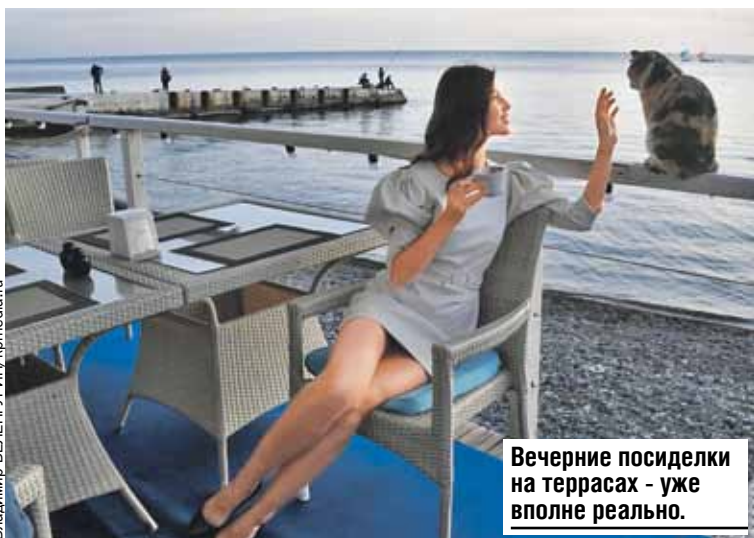
Вечерние посиделки на террасах - уже вполне реально.

благодаря сочетанию нескольких факторов: близости к морю и Кавказским горам, которые защищают город от осадков и ветра. К тому же это субтропики. В конце мая может быть и плюс двадцать, и теплее. В общем, как повезет. Купаться, конечно, рановато, но урвать почти летнего тепла скорее всего получится.