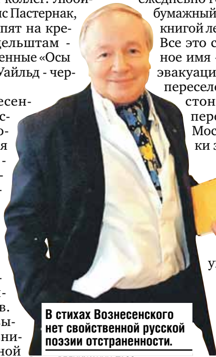
В стихах Вознесенского нет свойственной русской поэзии отстраненности.